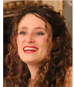
P. 20 C. DELGADO