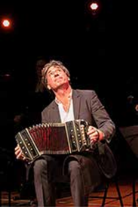
Illustration de couverture : Juanjo Mosalini lors du concert-hommage à Juan José Mosalini.