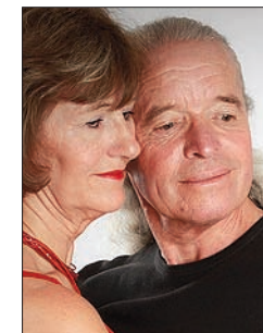
P. 18 Y. LE GOFF