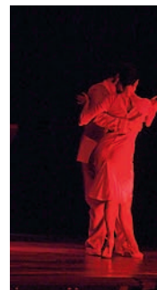
Illustration de couverture : La danse dans tous ses états.