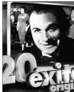
P. 41 DISCOGRAPHIE