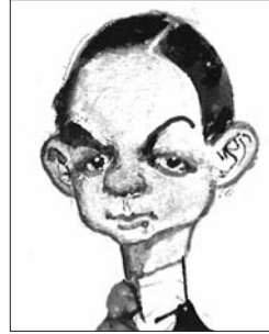
P. 10 EXPOSITION

Illustration de couverture : Aníbal Troilo vu par Hermenegildo Sábat (reproductions des dessins avec l'aimable autorisation du CICDP)