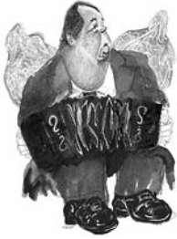
Illustration de couverture : Aníbal Troilo vu par Hermenegildo Sábat (reproductions des dessins avec l'aimable autorisation du CICDP)