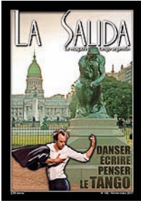
Illustration de couverture :

La reproduction du "Penseur" d'Auguste Rodin, telle qu'elle apparaît devant le Congrès à Buenos Aires