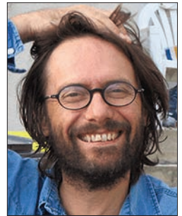
P. 12 C. APPRILL