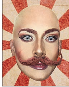
P. 10 TANGO QUEER

Illustration de couverture : Pratique de La Sourdière