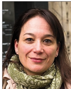
P. 42 L. ALCOBA