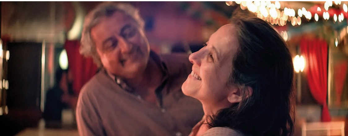
La métamorphose de Teresa sous les yeux del Gringo

La Fiancée du désert, de Cecilia Atán et Valeria Pivato, nous dit la métamorphose d'une femme qui se révèle à la cinquantaine. Une histoire simple, traitée avec délicatesse et un joli duo d'acteurs.