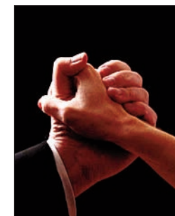
P. 10 L'ABRAZO