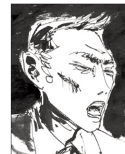
P. 48 ÉTIENNE M