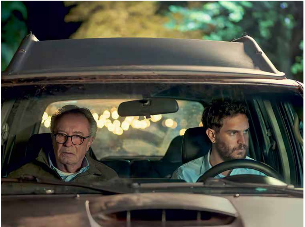
NETFLIX CLEO BOUZA

Dans El último gigante , un père et un fils affrontent les blessures du temps. Marcos Carnevale les installe devant les majestueuses chutes d'Iguazú et flirte avec le clip touristique et la leçon de morale.