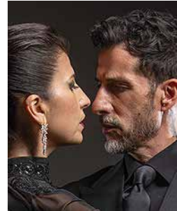
P. 34 Los Totis