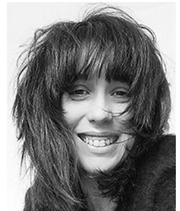
P. 52 V. Uva