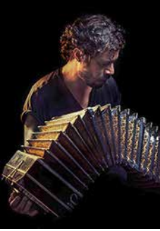
Illustration de couverture : Patricio Bonfiglio El Sindicato milonguero