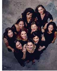
P. 8 FLEURS NOIRES